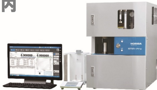
固体中炭素・硫黄分析装置 EMIA-Pro/Expert

AOPとは HORIBA製品の保守点検サービスを包括的に提案する 「All in One Plan」の略称。年一回の保守点検、修理作業時の 部品交換、装置復旧時の作業費などサポートに必要な費用が含ま れております。各種プランによって内容は異なります。