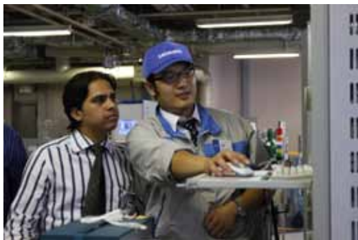
海外エンジニアも含めたサービス研修

(株)堀場テクノサービスは、2011年9月に新たに四国サービスステーションを開設し、全国26箇所の拠点となりました。拠点拡大により、更に地域密着したサービスを提供しています。また、海外においてもアジアを中心にお客様のサポートを強化、さらにフィールドエンジニアのスキルアップ・トレーニングの充実、技術ノウハウ情報システムや部品供給システムの整備などグローバルレベルでより迅速で高品質なサービスの提供をめざす取り組みを進めています。2011年は夏季節電対応に伴うお客様の土日稼働に合わせたサポート体制を敷くなど、お客様のご要望に応じた対応を積極的に行いました。今後も常にお客様とともに最適な分析・計測環境づくりに貢献してまいります。