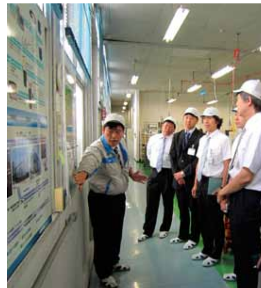
HORIBA 製品勉強会の様子 (2011年6月)

特に、6月実施の「HORIBA 製品勉強会」では、生産協力会社のメンバーに HORIBA 製品について学んでいただくとともに、納品していただいた部材がどのように使用され、どのような役割を果たしているかを工場で見学させていただくことで、HORIBA 製品に求められる高い品質要求を知っていただきました。このように、サプライヤーと HORIBA がうまく連携し互いに切磋琢磨することで、品質意識の向上や生産現場改善、技術力の向上につなげています。