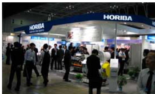
自動車技術者のための日本最大の自動車技術展 『人とするまのテクノロジー展 2012』

HORIBA グループでは国内外で多数の展示会に出展し、グループ各社の新製品や技術力を積極的に披露しています。また、ホスピタリティの向上に努め、「HORIBA Hospitality Suite (ホリバ・ホスピタリティ・スイート)」を継続しているなど、お客様の声や反応を直接お聞きするだけでなく、より深い絆をつくることのできる貴重なコミュニケーションの場として重視しています。