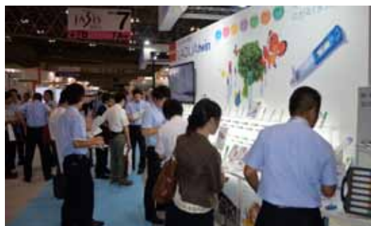
最新の分析機器・科学機器が集結するアジア最大級の展示会『JASIS2012』