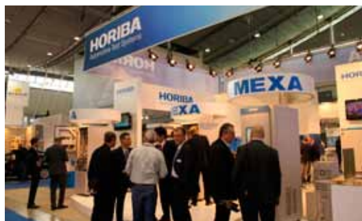
ヨーロッパ自動車計測業界の見本市 『Automotive Testing Expo Europe 2012』(ドイツ・シュツットガルト)