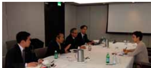
北米での社長によるIR活動