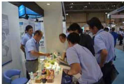
展示会ブースツアー