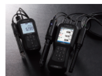
マルチデジタル水質計 D-200/WQ-300 シリーズ

上水・下水・環境水から排水まで、私たちの暮らしに欠かせない「水」に関する分析機器やソリューションを紹介します。