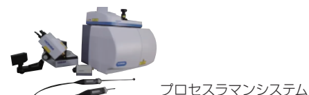
プロセスラマンシステム

試料のセットから測定データのレポート化までの自動化や、インラインでの試料状態のリアルタイムモニタリングなど、工数削減・人的要因の排除・危険作業の回避を目的とした分析ソリューションを紹介します。