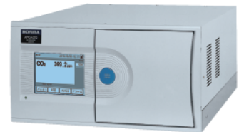
大気監視用 CO 2 濃度測定装置 APCA-370