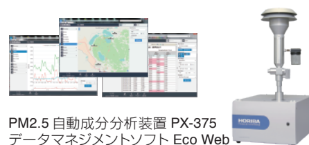
PM2.5自動成分分析装置 PX-375 データマネジメントソフト Eco Web

自社敷地外の環境モニタリングのリモート化やそれらのデータの集約、フィードバックを含めたデータマネジメントを紹介します。また、据え置き型分析装置のリモートメンテナンス、データインテグリティ確保などのソリューションも紹介します。