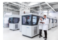
燃料電池評価装置 Evaluator シリーズ

二次電池・燃料電池のナノレベルの材料評価から、セル・スタックの発電評価、電動車両システムの性能評価まで、電動車両の研究開発・検証に貢献する幅広い分析・計測ソリューションを紹介します。