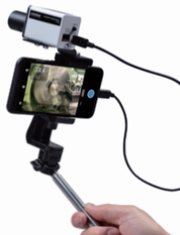
非接触放射温度計 IT-480 シリーズ用 スマートフォンアプリ IT-480camera