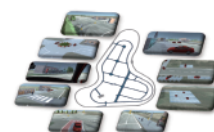
自動運転市街評価路

最先端の自動運転・交通システムのモデルベースエンジニアリングや、安全性エンジニアリング、ADAS・自動運転の評価設備など、英国を拠点とする HORIBA MIRA を中心とした、コネクテッド・自動運転車両エンジニアリングサービスを紹介します。