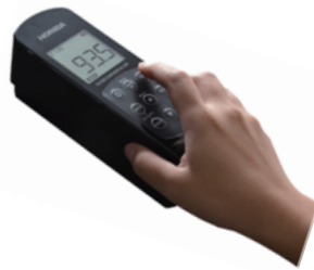
光沢計 グロスチェッカ IG-340